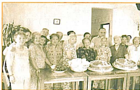
福恩之家的老人同慶祝生日