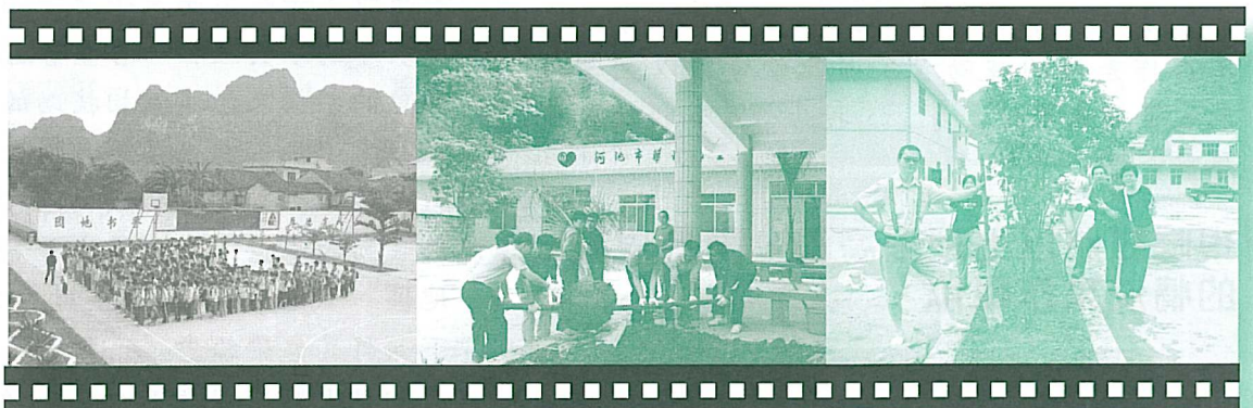
植樹活動 教牧團23人連同院內同工同心合力栽種了20多株樹

此行大家都認同兒童村除了以基督的愛教育和撫養兒童外，同時兒童村也是福音外展中心，以閱覽室形式服務當地社區和華恩助學工程的受助學生等，是神為我們預備的一個福音禾場。願神賜福這事工！