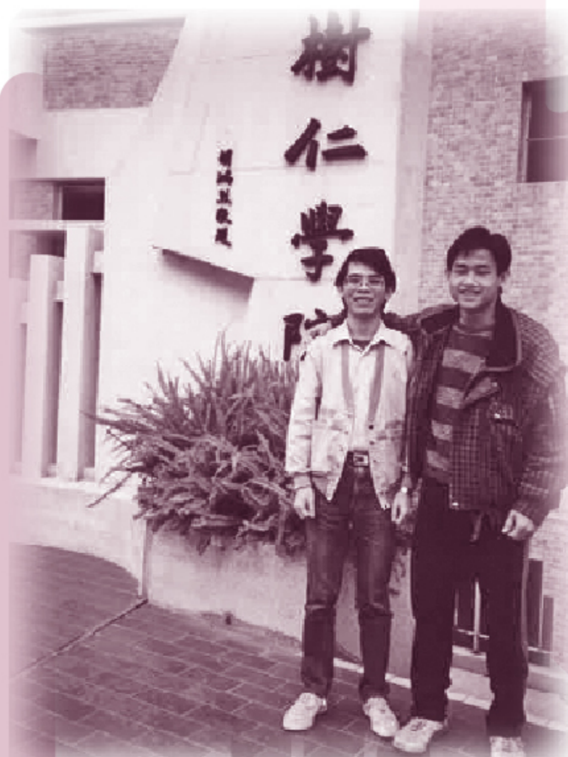
筆者（左）在樹仁讀書時所攝

有信徒說一般情況下，人多是在25歲前信主，即約大學畢業前。當人進入社會工作後，就更難信主。筆者也同意這觀點，大學生的心思都是較為單純，容易對福音有回應，否則當他們面對物質的花花世界，就被吸引而不願聽福音了。所以筆者認為大學生的福音工作是非常重要的。