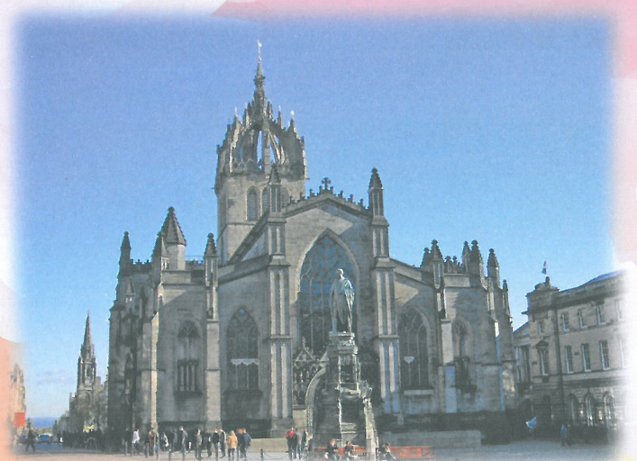
聖吉爾斯大教堂(St. Giles' Cathedral)

遊覽愛丁堡的遊客一個必到之處，便是源自十二世紀的聖吉爾斯大教堂（St. Giles' Cathedral）。據說教堂的塔頂是仿照蘇格蘭王冠設計，經過數百年的風風雨雨，仍能清楚給人感受到其威儀。誰知這堪稱為「長老宗母堂」的教堂，也是蘇格蘭的改教家約翰·諾克斯（John Knox）(1510-1572) 所事奉的地方。諾克斯的講道充滿能力，深深影響著當時的信徒，促成了1560年蘇格蘭的宗教改革，令蘇格蘭人的信仰得以重生。當不少傳道人為其宣講而受害受死之時，他仍抗拒崇拜聖母瑪利亞，堅持聖經的權威必須高於政權，更指出當時政權如何犯罪。據說連當時信奉天主教的蘇格蘭女王瑪麗一世也說過，「我懼怕諾克斯的禱告，多於全歐洲結集的軍隊」（I fear the prayers of John Knox more than all the assembled armies of Europe）。 1 即使在他