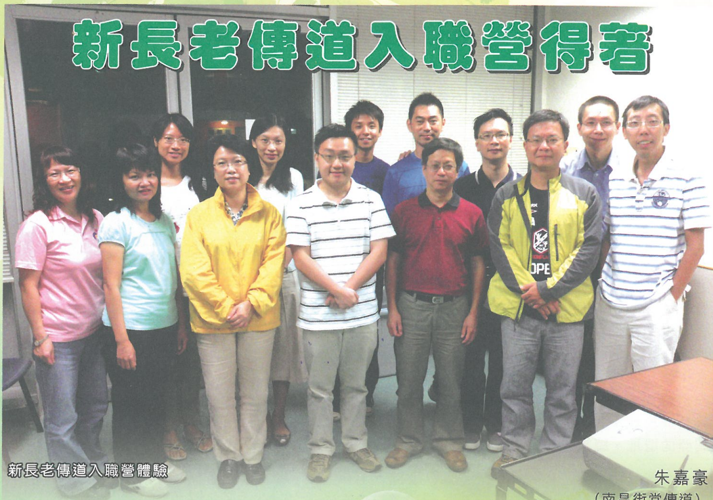
新長老傳道入職營體驗